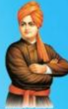
గురు హాయి బాలా