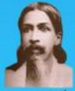
గురు రమణ మహర్షి