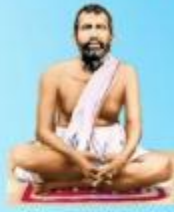
గురు రామకృష్ణ పరమహంస, అమ్మ శారదాదేవి