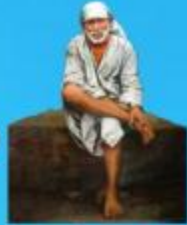
గురు హాయి బాలా