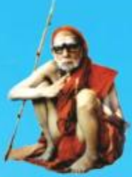
గురు చంద్రకీర్తిర పరమాచార్య