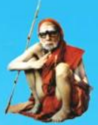
గురు చంద్రకీర్తిర పరమాచార్య