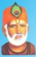
గురు కబీర్ దాస్