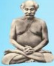
గురు లాహిరి మహాశయి