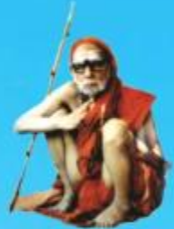
గురు చంద్రకీర్తిర పరమాచార్య