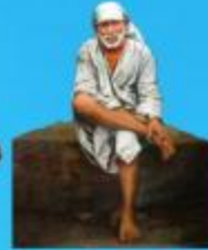
గురు హాయి బాలా