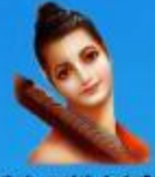
గురు వారద మహర్షి