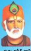
గురు కబీర్ దాస్