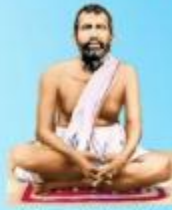
గురు రామకృష్ణ పరమహంస, అమ్మ శారదాదేవి