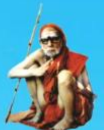
గురు చంద్రకేశవర పరమాచార్య