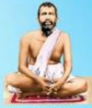
గురు రామకృష్ణ పరమహంస, అమ్మ శారదాదేవి