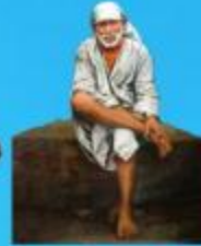
గురు హాయి బాలా