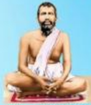
గురు రామకృష్ణ పరమహంస, అమ్మ శారదాదేవి