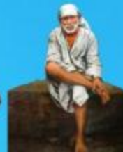
గురు హాయి బాలా