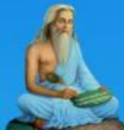
గురు వాల్మీకి మహర్షి