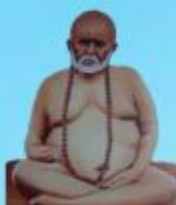
గురు వైలింగ్ స్వామి