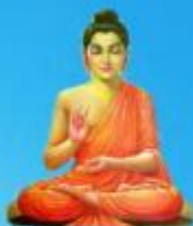
గురు గోరమ బుద్ధ