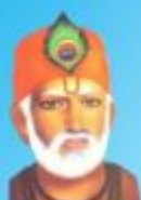
గురు కబీర్ దాస్