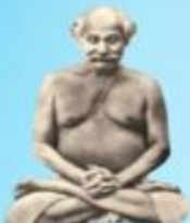
గురు లాహిరి మహాశయి