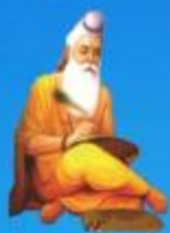
గురు వేదవ్యాస మహర్షి