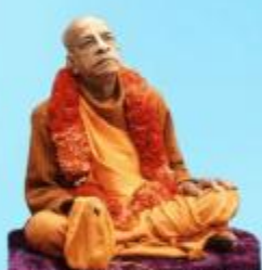
గురు భక్తవేదాంత ప్రభుపాద