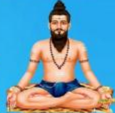
గురు వీరబ్రహ్మేంద్ర స్వామి