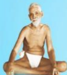
గురు రమణ మహర్షి