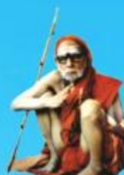
గురు చంద్రకేశవర పరమాచార్య