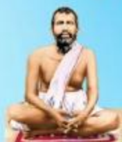
గురు రామకృష్ణ పరమహంస, అమ్మ శారదాదేవి