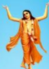
గురు చైతన్య మహా ప్రభువు