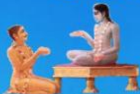
గురు శుక మహర్షి