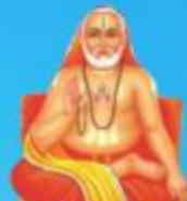
గురు రాఘవేంద్ర స్వామి