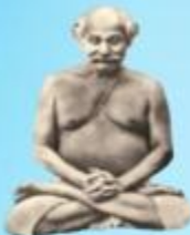
గురు లాహిరి మహాశయి