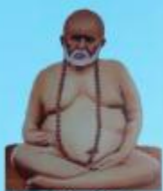
గురు వైలింగ్ స్వామి