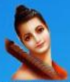
గురు వాసదత్త మహర్షి