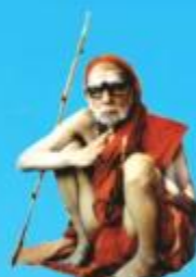
గురు చంద్రకీర్తిర పరమాచార్య