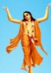
గురు చైతన్య మహా ప్రభువు