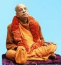
గురు భక్తవేదాంత ప్రభుపాద