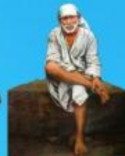
గురు హాయి బాలా