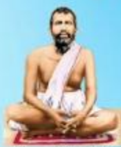
గురు రామకృష్ణ పరమహంస, అమ్మ శారదాదేవి