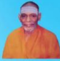
గురు చంద్రశేఖర పరమాచార్య