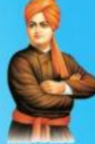
గురు హాయి బాలా