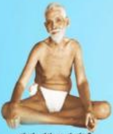
గురు రమణ మహర్షి