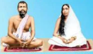
గురు రామకృష్ణ పరమహంస, అమ్మ శారదాదేవి