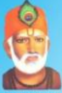
గురు కబీర్ దాస్