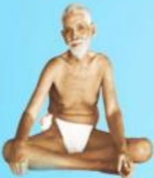
గురు రమణ మహర్షి