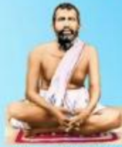
గురు రామకృష్ణ పరమహంస, అమ్మ శారదాదేవి