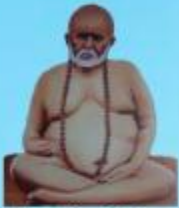
గురు వైలింగ్ స్వామి