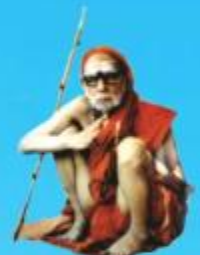
గురు చంద్రకీర్తిర పరమాచార్య