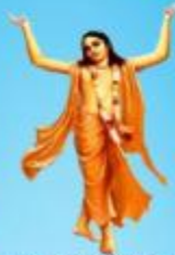
గురు చైతన్య మహా ప్రభువు