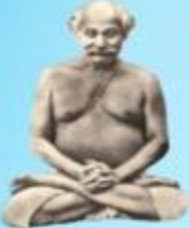
గురు లాహిరి మహాశయి