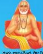
గురు రాఘవేంద్ర స్వామి