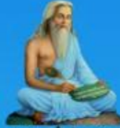
గురు వాల్మీకి మహర్షి