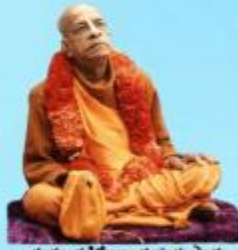
గురు భక్తవేదాంత ప్రభుపాద