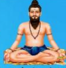
గురు వీరబ్రహ్మేంద్ర స్వామి