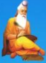
గురు వేదవ్యాస మహర్షి