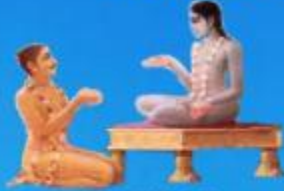
గురు శుక మహర్షి