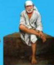
గురు హాయి బాలా