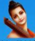
గురు వాదర మహర్షి