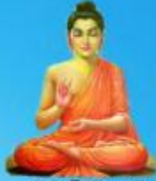
గురు గోరమ బుద్ధ